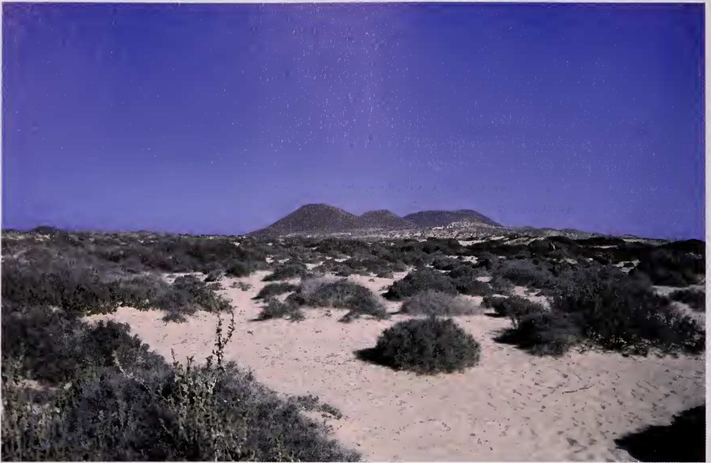
Foto 1.- Los arenales de La Graciosa, dominados por quenopodiáceas, son el hábitat típico de Agrotis lanzarotensis .